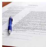
Requisitos de inscripción