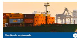
Cambio de contraseña