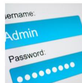
Acceso a SPRC Online

Todos los actores involucrados en la cadena del comercio exterior encuentran una alta eficiencia en la Organización Puerto de Cartagena, gracias a los avances tecnológicos y a los sistemas de vanguardia. Un amplio número de procesos se pueden realizar por Internet, a través de SPRC Online. Así se acortan los tiempos y se agilizan los trámites. Además se brinda acceso a información en tiempo real.