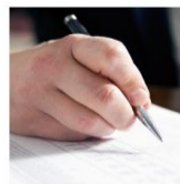
Formatos y procesos