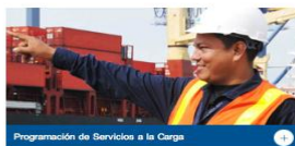
Programación de Servicios a la Carga