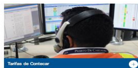
Tarifas de Contecar