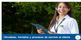
Circulares, formatos y procesos de servicio al cliente