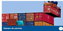
Número de servicio