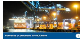
Formatos y procesos SPRCOnline